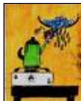
FIGURA 2. Simulação de uma chuva

Num segundo momento demonstrou-se em sala de aula como ocorre o ciclo da água na Terra através de duas experiências, cujo intuito foi o de despertar interesse, além de fixar melhor a aprendizagem e atenção dos alunos. A primeira experiência foi como simular a chuva. Antes do início do ensaio foram apresentados todos os materiais a serem utilizados: uma cafeteira, dois pratos pequenos, fogão elétrico, água, gelo e sal. Ao iniciar o procedimento ligou-se o fogão elétrico em uma tomada de 220 W, deixando esquentar a cafeteira para em seguida adicionar 300 mL de água potável dentro da cafeteira juntamente com 5 g de sal de forma a deixar a substância presente do recipiente salgada. Em seguida adicionou-se 4 cubos de gelo em um prato suspenso por uma pinça acima da boca da cafeteira, permitindo que o vapor quente vindo da cafeteira sofresse resfriamento como mostra a Figura 2. Posteriormente colocou-se outro prato abaixo da boca da cafeteria de modo que quando a água que foi condensada através do vapor quente da água da cafeteira entrasse em contato com o gelo do prato colocado acima do vapor viesse a precipitar (chover) e caísse no prato abaixo da cafeteira. Em seguida foi solicitado o auxílio de um aluno voluntário para conferir se aquela água que precipitou estava doce ou salgada e ele respondeu que estava doce. Assim, foi mostrado um método alternativo de dessalinização de água e ao mesmo tempo o ciclo da água na natureza.