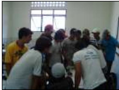
FIGURA 1. Grupo de alunos observando a montagem das experiências