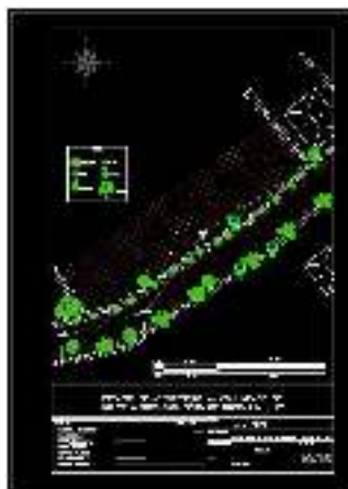
FIGURA 3. Layout paisagístico do vilarejo

Dentre as principais conclusões do trabalho percebemos a necessidade de instrução e capacitação de jovens para valorização do trabalho, a partir da criação de oportunidades para o crescimento comunitário. Um dos maiores problemas enfrentado na interação da comunidade com universidades é o tempo insuficiente para consolidação de um trabalho de formação se desenvolver. Demanda-se a criação de um trabalho duradouro e contínuo entre universidades, órgão governamentais com a comunidade, para que a mesma se sinta forte suficiente para um dia caminhar no seu próprio compasso, e contribuir para a sustentação dos recursos naturais e culturais tão ricos na região.