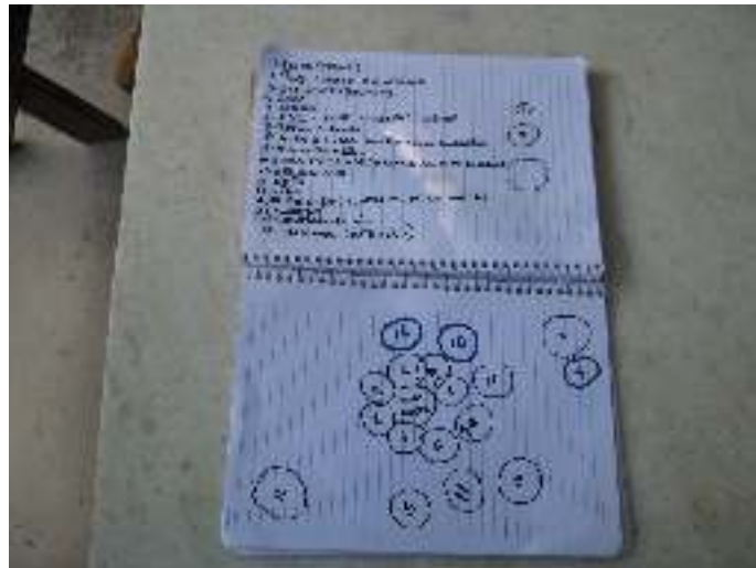
FIGURA 2. Construção do Diagrama de Venn para facilitação da discussão entre os membros do grupo

Como estratégia de “quebra-gelo” e para início de discussão sobre a vida na vila, uma das primeiras atividades nos trabalhos de grupo foi o desenho diagrama de Venn para posterior confecção do croqui da vila (Figura 2). Durante sua execução, buscava-se identificar os elementos relevantes e estimular a discussão sobre os mesmos.