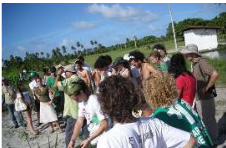
FIGURA 2. Intercâmbio agroecológico de pesquisadores e técnicos da Embrapa com estudantes na Reserva do Caju, Itaporanga D'Ajuda, SE.