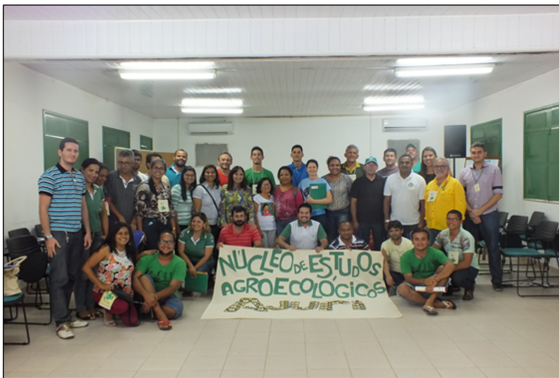
Figura 02 – Participantes da primeira etapa do curso de capacitação.