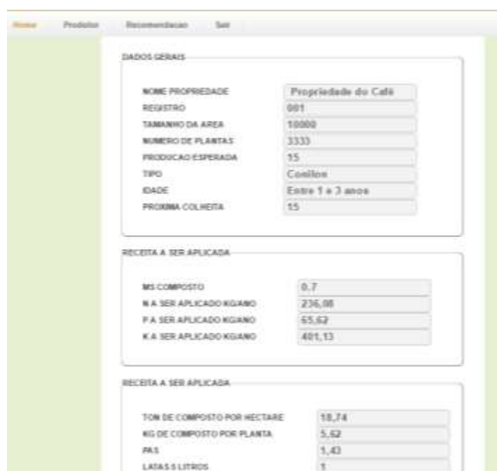
Figura 7. Tela de exibição do resultado da recomendação da quantidade a ser aplicada do composto orgânico na lavoura, para impressão.

O formulário de reposta da recomendação, responsável por trazer na tela os resultados dos cálculos executados no servidor, é como se espera a última página do sistema, com campos bloqueados para alteração, permitindo apenas a visualização dos dados (Figura 7). Após a geração da recomendação, o sistema oferece a opção de imprimir a recomendação ou reiniciar o processo, fazendo então outra recomendação para a mesma área ou para outra.