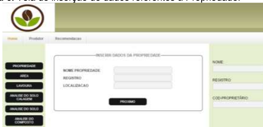
Figura 6. Tela de inserção de dados referentes à Propriedade.