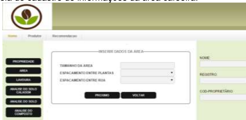
Figura 5. Tela de cadastro de informações da área cafeeira.

Para controle geral posterior, foram criados outros formulários que são responsáveis para identificar cada área e propriedade, possibilitando assim um controle personalizado ao longo do tempo por parte do sistema em relação a determinado trecho da plantação. A seguir, são apresentadas as telas de inserção de dados referentes à área (Figura 5) e da propriedade (Figura 6).