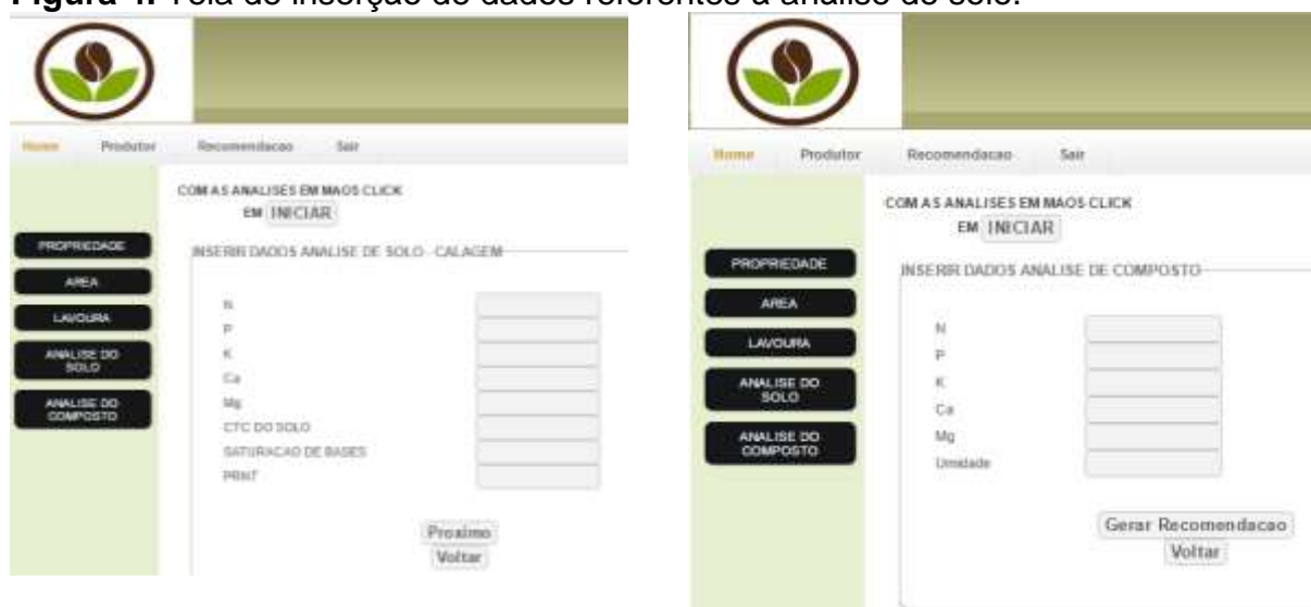
Figura 4. Tela de inserção de dados referentes à análise de solo.