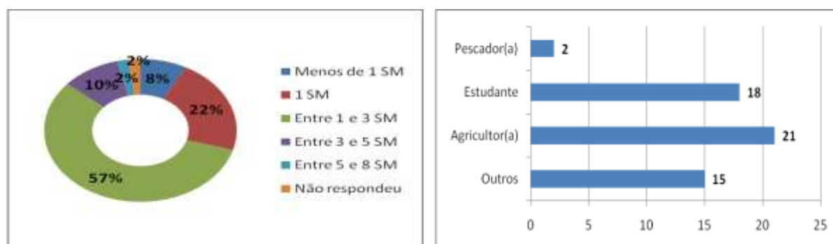
Figura 2. a) Renda mensal Familiar dos/das jovens cursistas. b) Ocupação principal dos/das jovens cursistas.

Segundo estudos da Organização das Nações Unidas para Alimentação e a Agricultura - FAO, entre 2001 e 2012, a renda dos 20% mais pobres da população brasileira cresceu três vezes mais do que a renda dos 20% mais ricos. Em um horizonte mais amplo, de 1990 a 2012, a parcela da população em extrema pobreza