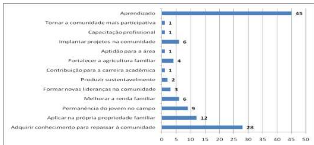
Figura 3. Motivos que levaram os/as jovens ingressarem no Projeto Sementes Agroecológicas.

Processo de capacitação e formação é de suma importância para o/a jovem escolher permanecer no campo. Assim as ações do Projeto Sementes Agroecológicas visa capacitar esses jovens em atividades produtivas, bem como,