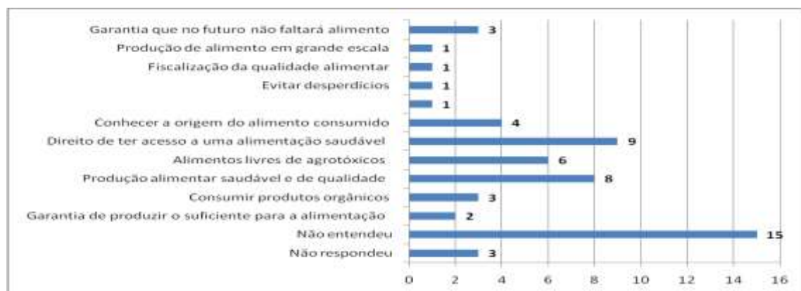
Figura 5. O que os/as jovens cursistas entendem por Segurança e Soberania Alimentar.

Ao observar a figura 5, trás um dado preocupante que 15 jovens não compreendem o que é segurança e soberania alimentar, juntamente com três ausência de resposta, o que aumenta ainda mais esse dado. No entanto nove jovens responderam que é o direito de ter acesso a uma alimentação saudável, seguido da resposta que é uma produção alimentar saudável e de qualidade com oito respostas. Tem-se ainda como resposta: alimentos sem agrotóxicos apresentando quatro jovens. Todas as respostas remetem, segundo os/as jovens cursistas, segurança e soberania alimentar para alimentos saudáveis.