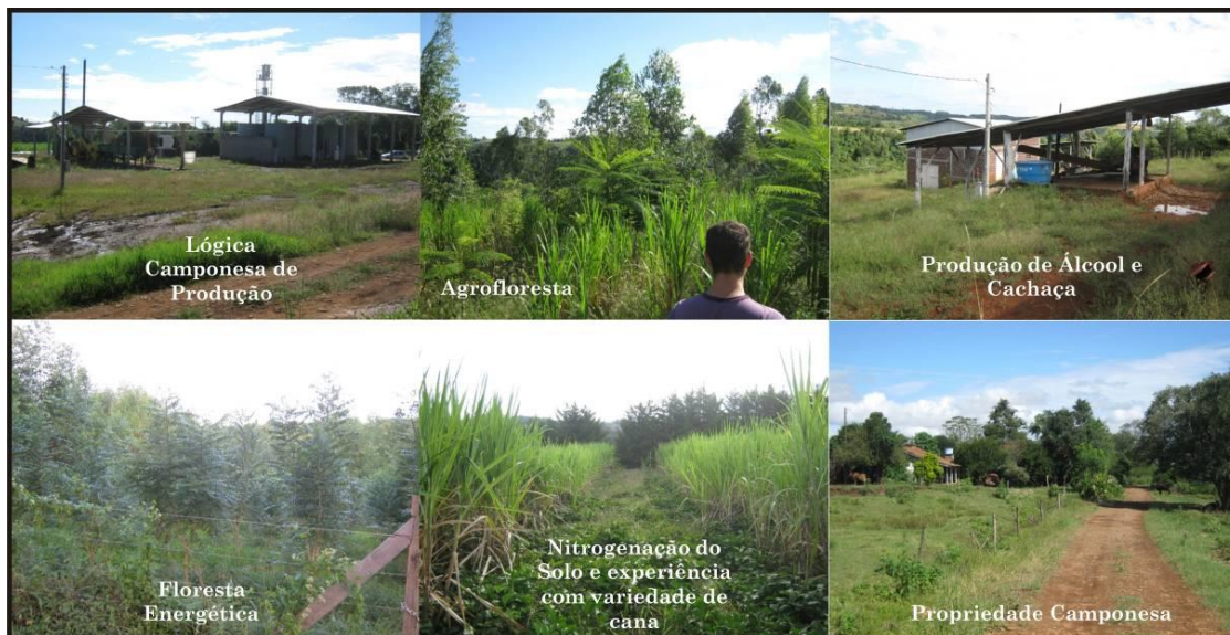
Figura 02 – Experiências da Produção Camponesa em Frederico Westphalen/RS e Caiçara/RS

Fonte: Trabalho de Campo em Frederico Westphalen/RS e Caiçara/RS. Org.: CUBAS, Tiago E. A. (2010).